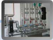
Heizungsverteiler Einfamilienhaus in Bayern