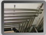
Wärmeleitungen Krankenhaus in Bayern