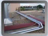
Solaranlage Hausdach in Spanien