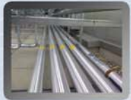
Wärmeleitungen Schuldach in England