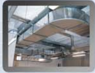
Klima- und Lüftungsanlage Hotel in Belgien