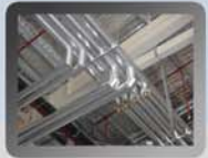
Wärmeleitungen Fitnesshalle in Australien