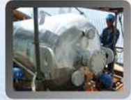
Tank einer Ölraffinerie Taiwan