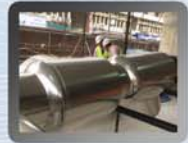
Industrielle Kühlleitungen Verein. Arab. Emirate